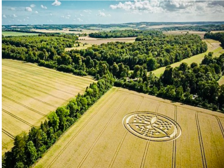
J 2 : Dimanche 5 Juillet 2026

Nuit à l'hôtel à Glastonbury ou alentours.